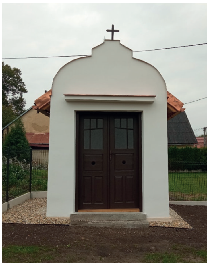
září 2021 – po obnově