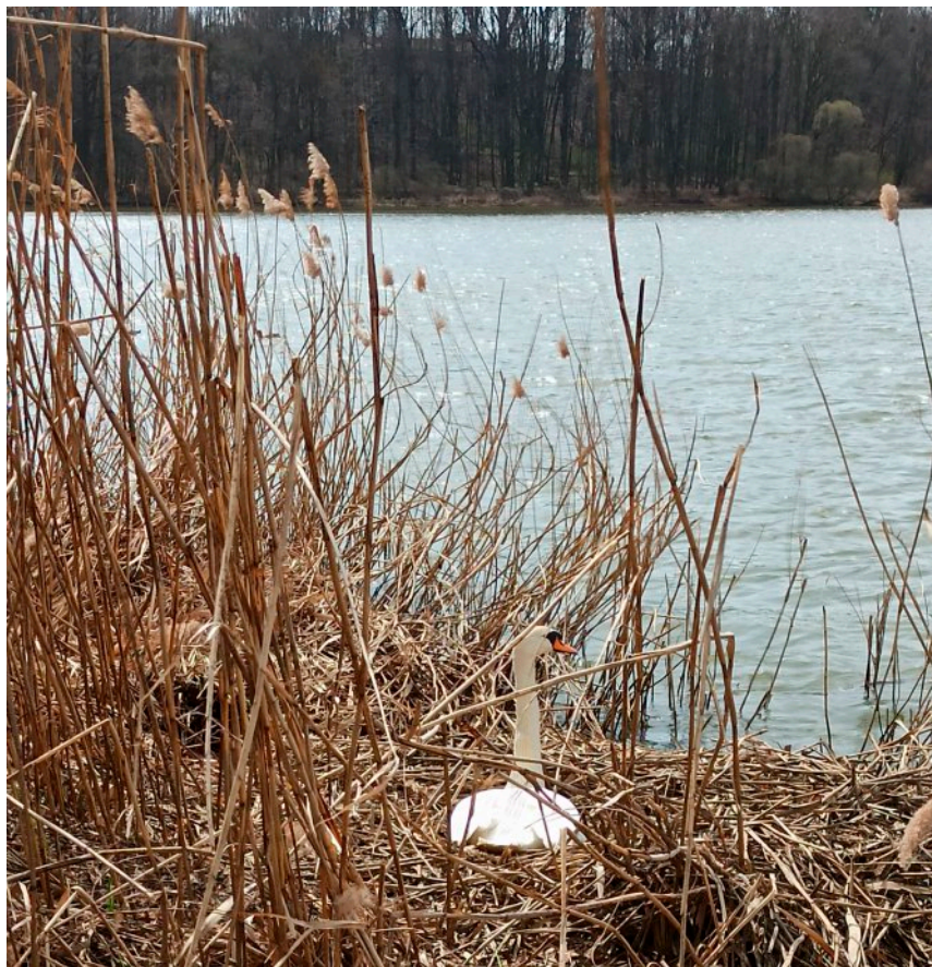
Hnízdící labuť na rybníku Kotvice 2021