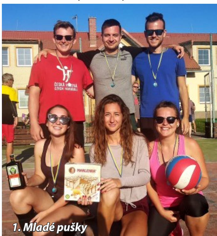
1. Mladé pušky

V sobotu 14. 9. 2019 se na hřišti u Centra volného času uskutečnil amatérský volejbalový turnaj smíšených družstev „O pohár starosty“ . Za pěkného počasí se mezi sebou utkalo 6 týmů. Utkání se hrála na 2 sety, za vítězství dostal tým 3 body a za remízu 1 bod.