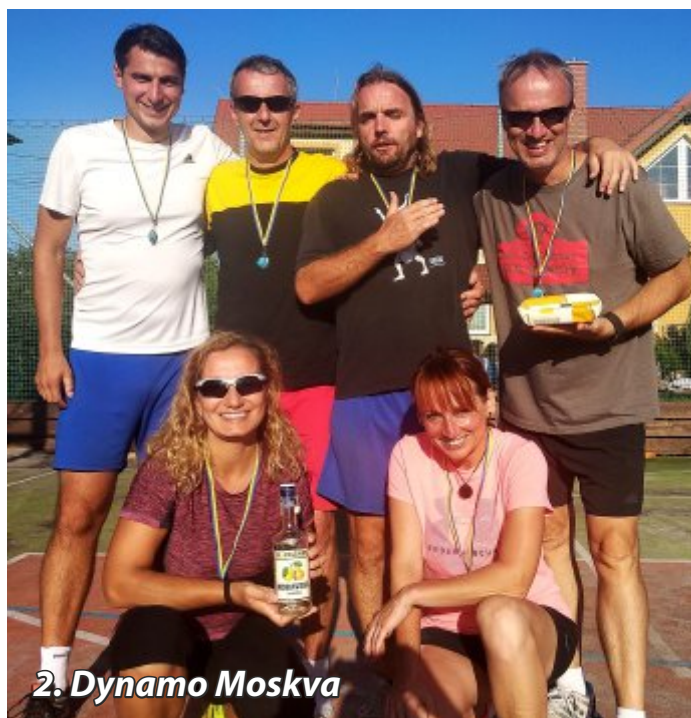
2. Dynamo Moskva

Vítězné týmy obdržely medaile a všichni za své sportovní snažení dostali sladkou i pitnou odměnu.