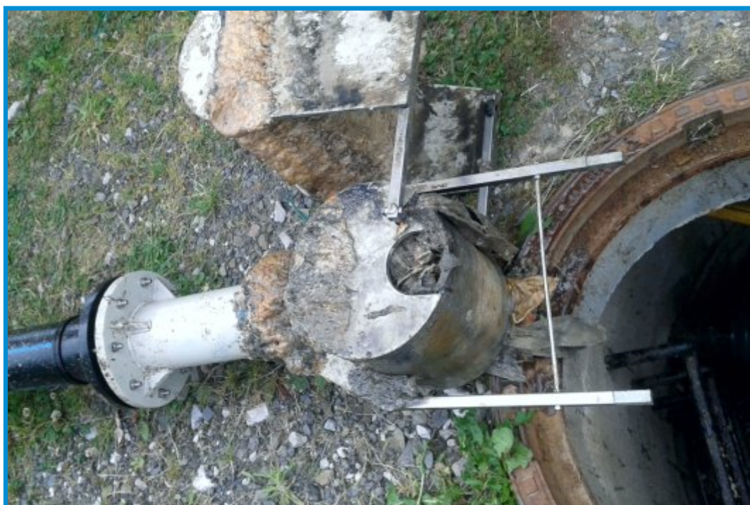
Foto: Podtlakový ventil zcela ucpaný hadrami a obalený 5 cm silnou vrstvou tuku