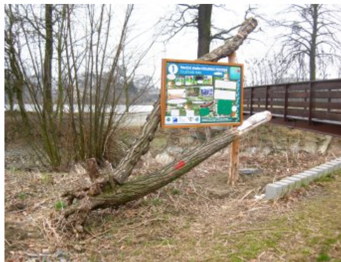
Úvodní zastavení u Jeseníku nad Odrou.

Bernartic nad Odrou je možné se na ni napojit poblíž mostu přes řeku. Stezka pak pokračuje dále souběžně se žlutou turistickou značkou směrem na Suchdol nad Odrou. Poslední, deváté zastavení se nachází asi 400 m od železničního nádraží (GPS: 49.6397208N, 17.9438247E).