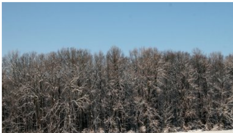
Les mezi rybníkem a příjezdovou komunikací