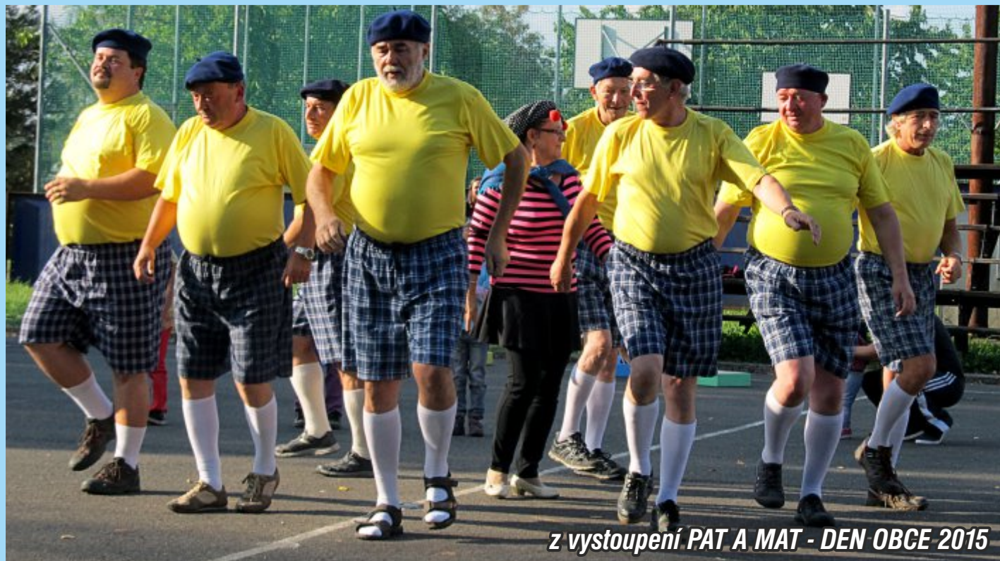
z vystoupení PAT A MAT - DEN OBCE 2015

ještě jednou poděkovat dětem a učitelům základní a mateřské školy, mladým hasičům, všem spolkům a organizacím podílejícím se na realizaci akce a přípravě vystoupení. Velké poděkování patří našim Patům a Matům a jejich cvičitelkám za krásné zpestření obecní slavnosti.