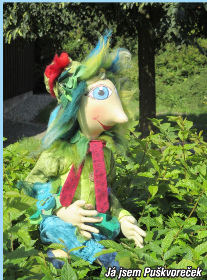
Já jsem Puškvoreček

Více informací naleznete na www.moravskekravařsko.cz a aktuálně Vás budeme informovat na FB Pohádkové Poodří a Poodří – Moravské