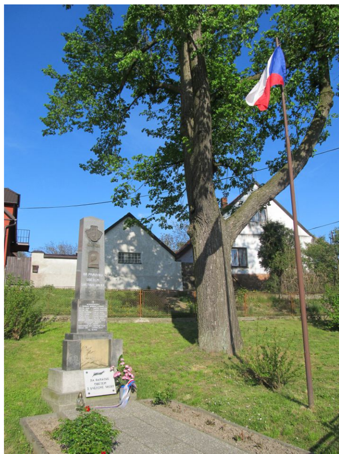
Památník obětem I. a II. světové války květen 2015