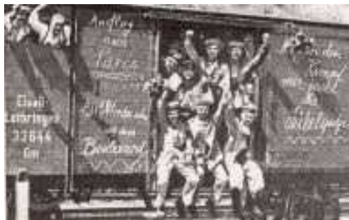
Obr. Němečtí vojáci odjíždějí na frontu

Obyvatelstvo muselo podporovat válku i penězi. Během války se konaly různé sbírky, často organizované školní mládeží. 1