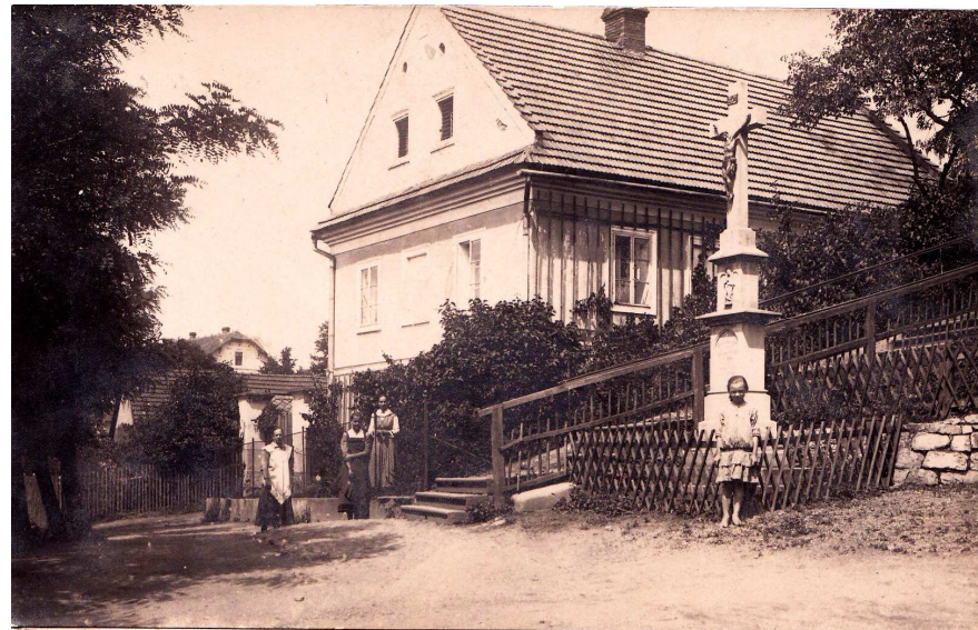
Obr. Fara v Albrechticích asi v roce 1918