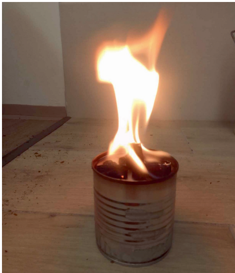
Skauti z Albrechtiček

Děkujeme všem, co se nějakým způsobem do sbírky zapojili.