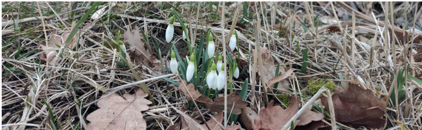
Sněženky na loukách březen 2023