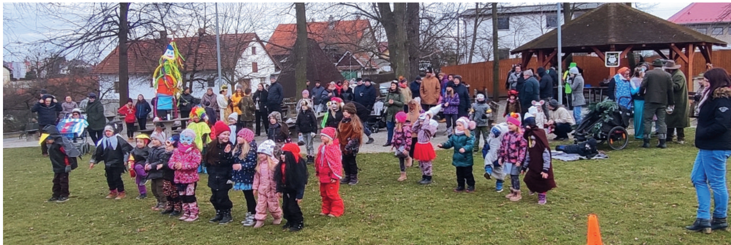
Masopust 2022, Foto: Radomír Volek