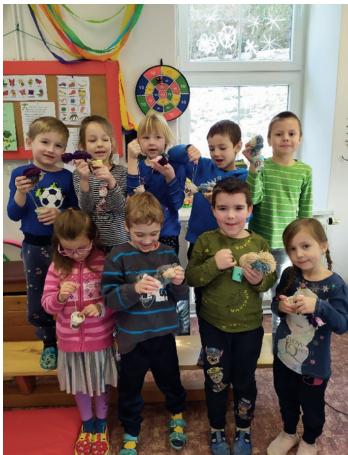
Foto: Staráme se o ptáčky

Ke konci měsíce jsme se věnovali zimním sportům. Dále v celém měsíci jsme průběžně procvičovali hrubou a jemnou motoriku, pravolevou orientaci, grafomotoriku, předčtenářskou gramotnost a matematické představy.